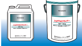
ショウワACプライマー 4kg ショウワACプライマー 18kg